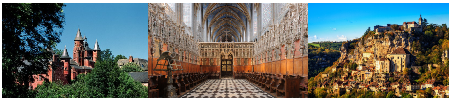
RUTA DE LOS CÁTAROS